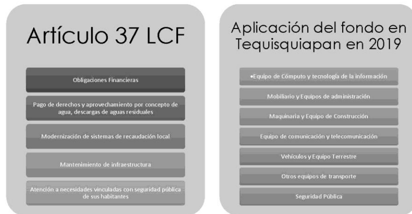
Figura 3. Lineamientos para el FORTAMUN-DF y su aplicación en el Municipio de Tequisquiapan para el Ejercicio Fiscal 2019

En el artículo 37 de la Ley de Coordinación Fiscal, se establece las áreas de aplicación para los recursos del FORTAMUN-DF, mismos que se comparan en el siguiente esquema con lo presentado por el Municipio a través de los reportes trimestrales del RFT correspondiente al 4to trimestre de 2019.