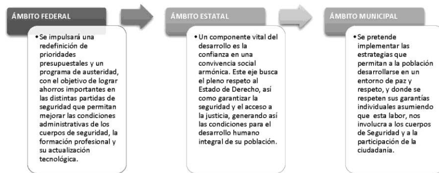
Figura 1. Alineación Federal, Estatal y Municipal